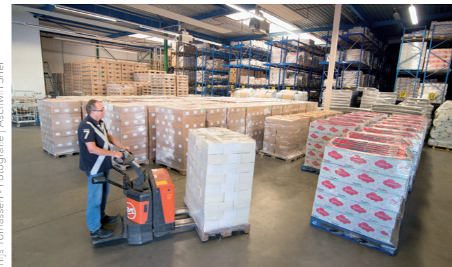
Tekst | Thijs Tomassen

De toekomst? Kom maar op, Today's is er klaar voor. 'Aan expansieve groei of uitbreiding denk ik niet eens. Dan waarborgen we de service zoals we die nu bieden niet meer. Op een gegeven moment zitten we hier aan ons plafond. Prima. We doen leuk werk en dan blijft het ook leuk.'